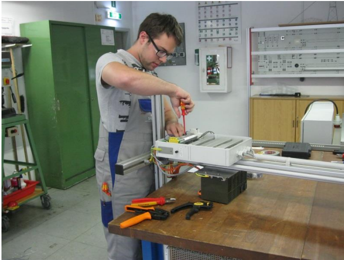
Elektroniker/ in für Automatisierungstechnik