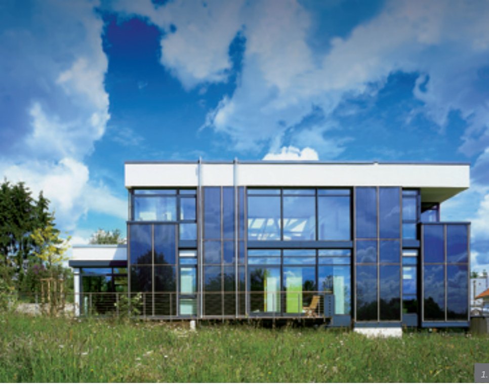
1. Privat house, Schiffweiler (D), Foto: Georg Becker